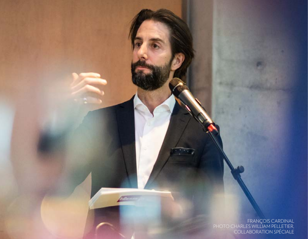
FRANÇOIS CARDINAL PHOTO CHARLES WILLIAM PELLETIER, COLLABORATION SPÉCIALE

« Quand vous nous lisez, quand vous consultez La Presse directement sur nos plateformes, vous contournez la désinformation et vous contribuez à préserver le métier de journaliste et l'information de qualité. »