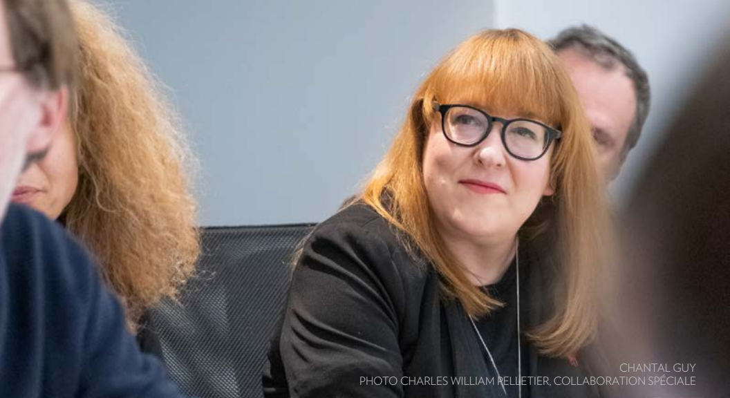
CHANTAL GUY